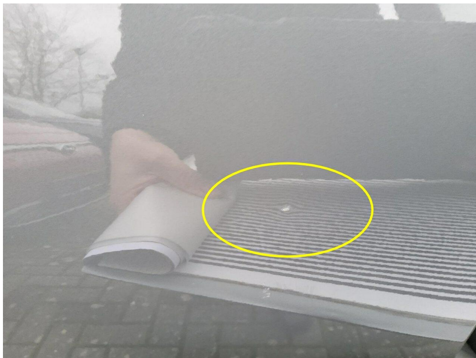
Bild 8 : Tür hinten rechts Lackierung, zerkratzt, eingedellt, instandsetzen und lackieren mit Lackaufbau