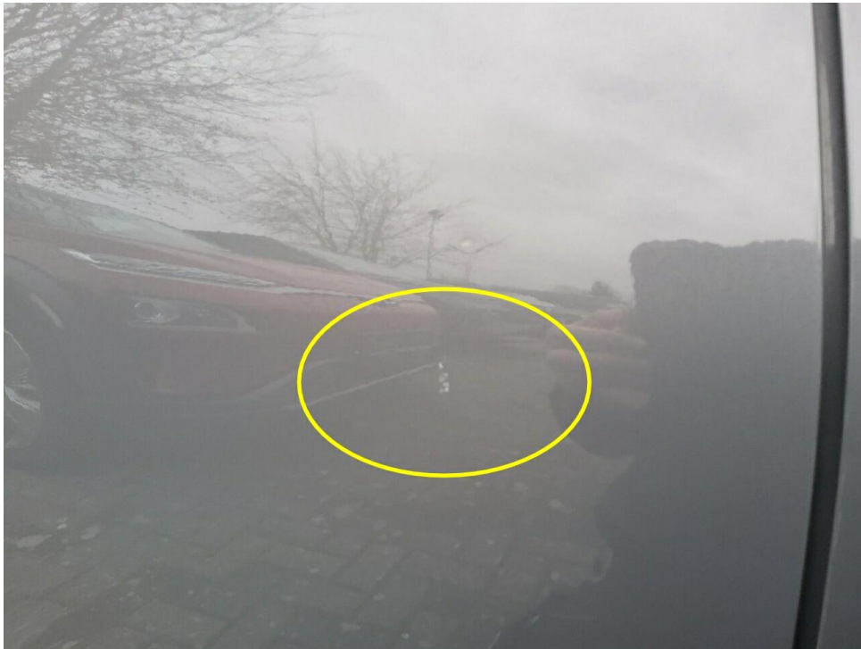
Bild 9 : Tür hinten rechts Lackierung, zerkratzt, eingedellt, instandsetzen und lackieren mit Lackaufbau