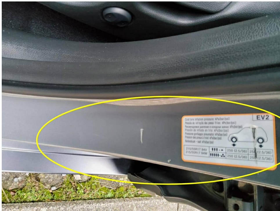
Bild 11 : Tür vorne links Einstieg Lackierung, zerkratzt, smart repair