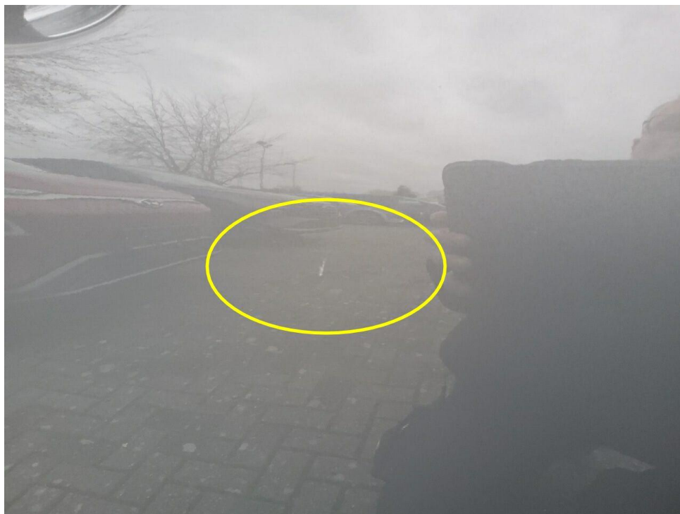
Bild 7 : Tür vorne rechts Lackierung, zerkratzt, lackieren mit Lackaufbau