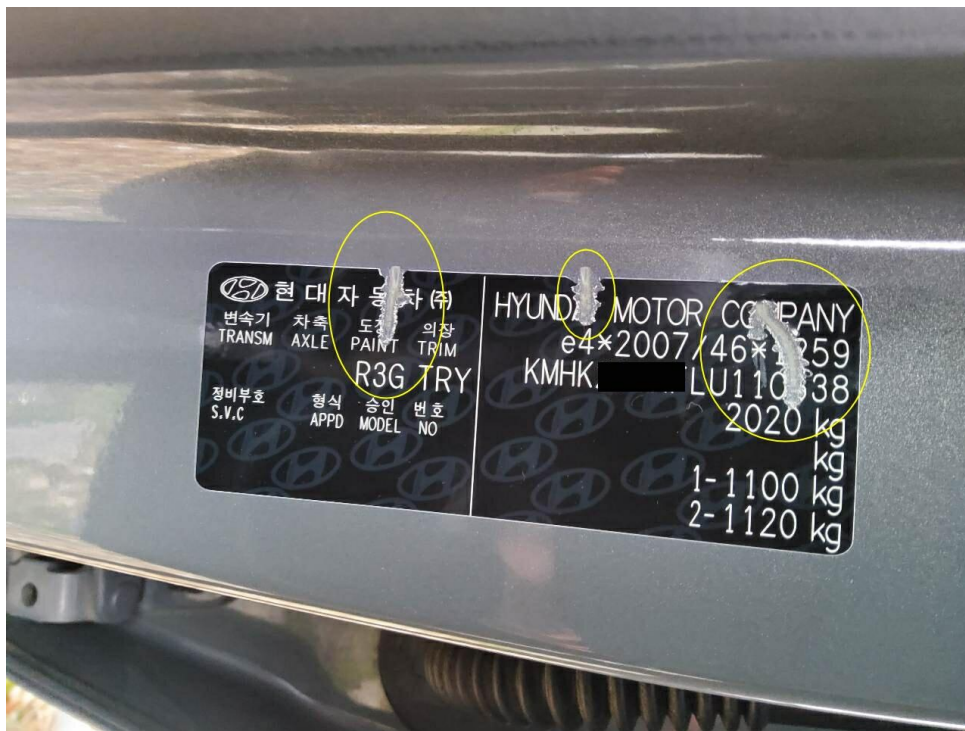
Bild 6 : Einstieg vorn links verschrammt, Typenschild verschrammt/nicht mehr lesbar