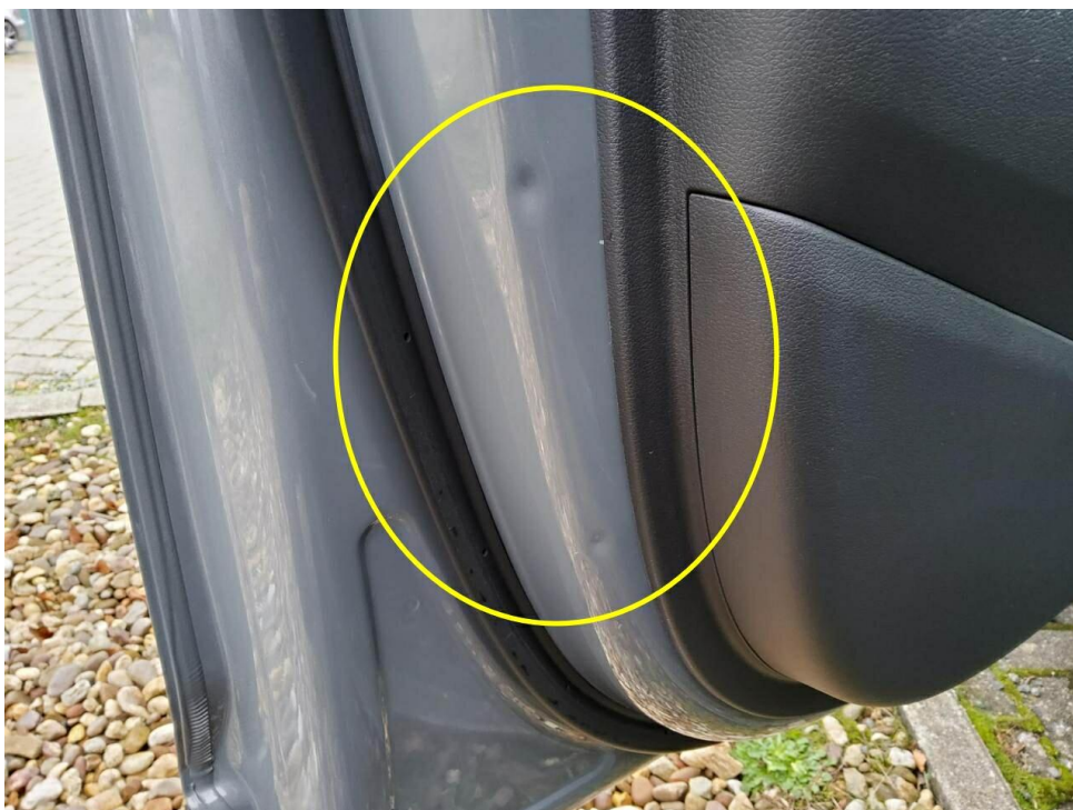
Bild 10 : Tür vorne links innen, mehrfach eingedellt, smart repair