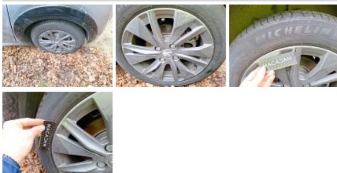
Jante alum. ARD, Griffe(s), E - Remplacer