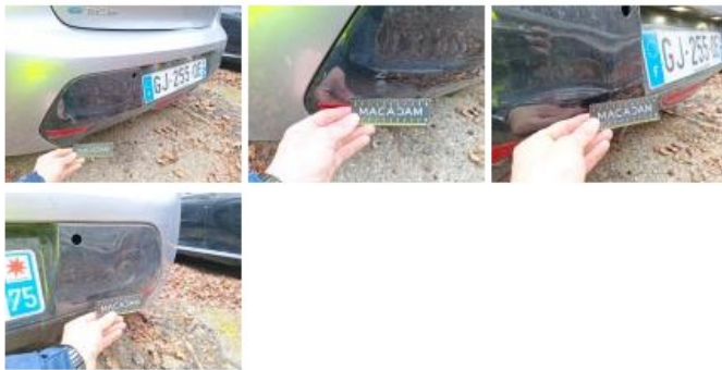
Capteur de parking AR, Manque, E - Remplacer