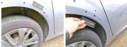
Moulure d'aile AVG, Griffe(s), Peindre