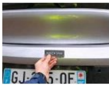
Jupe AR, Déformé / Forcé, Le - Remplacer et peindre