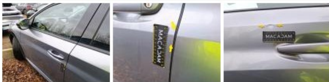
Porte ARG, Bosse(s), LI - Réparer et peindre (complet)