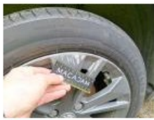
Jante alum. AVD, Griffe(s), E - Remplacer