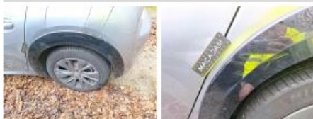
Obtuteur /Cache AV, Manque, E - Remplacer