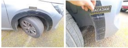
Boitier rétroviseur ext D, Griffe(s), Peindre