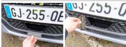
Calandre, Cassé, E - Remplacer