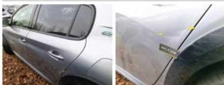
Moulure d'aile ARG, Griffe(s), Peindre