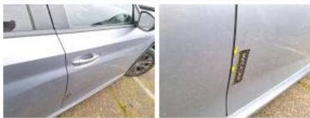
Moulure d'aile ARD, Manque, Le - Remplacer et peindre