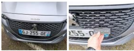
Pare-chocs AV, Griffe(s), Peindre