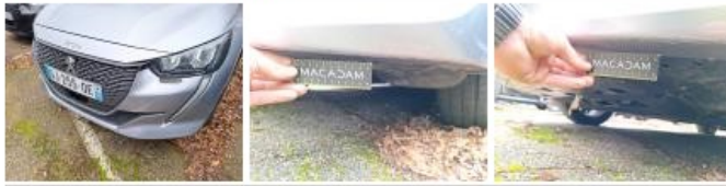
Moulure d'aile AVD, Griffe(s), Peindre