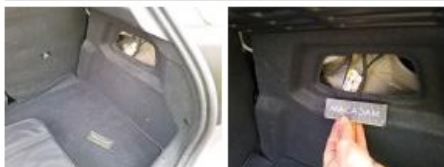
Cache bagages, Manque, E - Remplacer