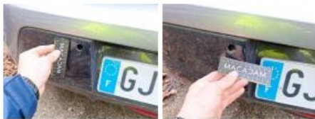
Capteur de parking AR, Manque, E - Remplacer