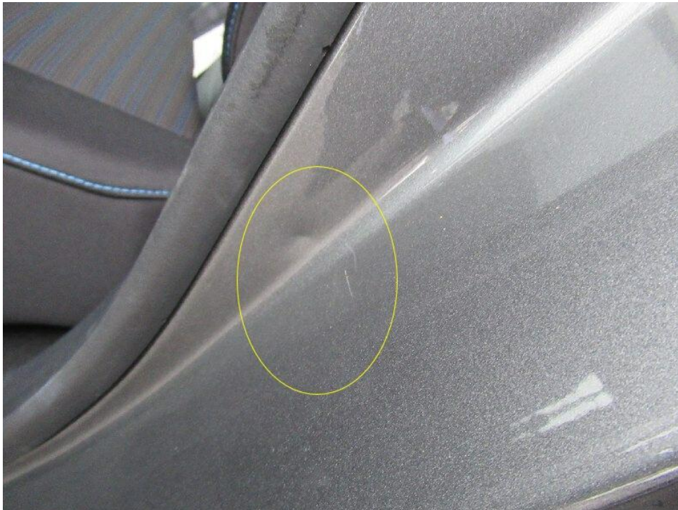
Bild 9 : Tür hinten links Einstieg Lackierung, zerkratzt, smart repair