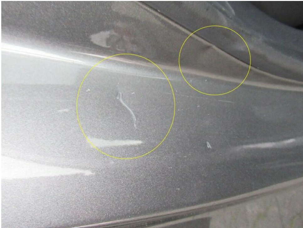
Bild 7 : Tür hinten rechts Einstieg Lackierung, zerkratzt, smart repair