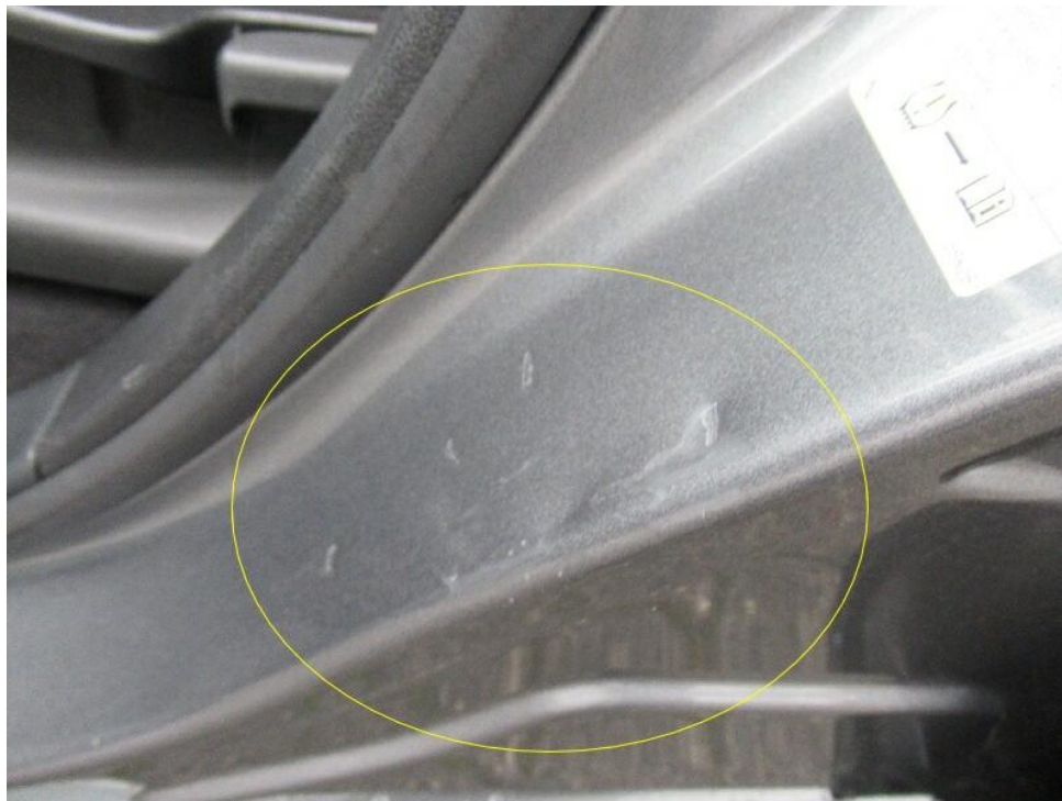
Bild 6 : Tür vorne links Einstieg Lackierung, zerkratzt, smart repair