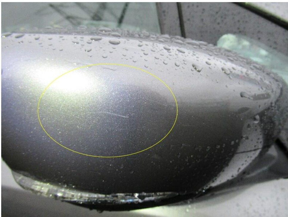
Bild 10 : Außenspiegel rechts Lackierung, zerkratzt, Gebrauchsspur