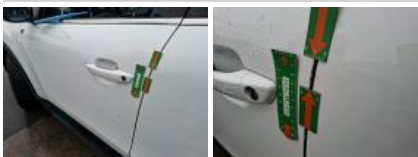
Porte ARD, Griffe(s), Acceptable