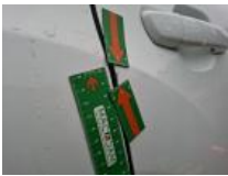
Porte AVD, Bosse(s), LI - Réparer et peindre (complet)