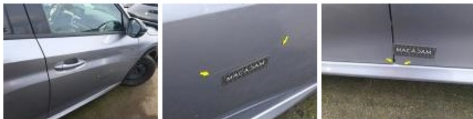
Aile AVD, Griffes), Peindre