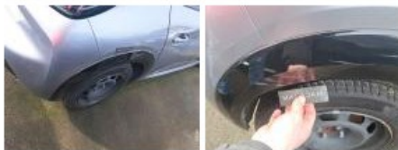
Aile ARD, Bosse(s), LI - Réparer et peindre (complet)