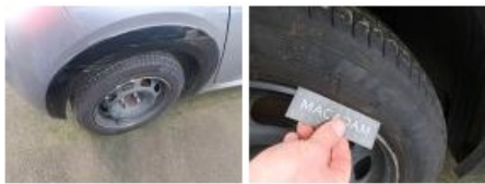
Jante tôle ARD, Déformé / Forcé, E - Remplacer