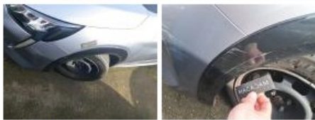
Porte AVG, Bosse(s), LI - Réparer et peindre (complet)