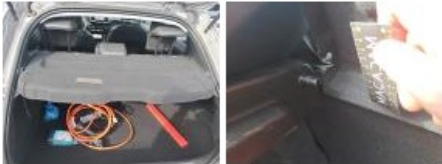
Garnit. mont pavillon ARD, Griffe(s), Acceptable