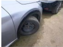
Pneu AVD, Déchirure, E - Remplacer