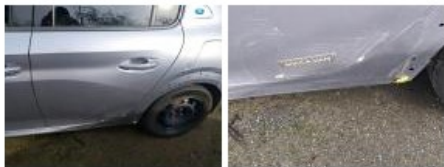
Moulure d'aile ARG, Manque, Le - Remplacer et peindre