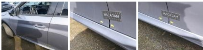
Bas de caisse ext G, Bosse(s), LI - Réparer et peindre (complet)