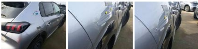
Porte ARD, Griffes), Peindre