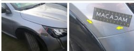
Moulure d'aile AVD, Griffes), Peindre