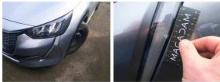
Capot, Griffes), Peindre