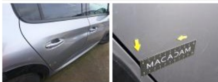
Porte AVD, Bosse(s) et griffe(s), LI - Réparer et peindre (complet)