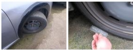
Moulure d'aile AVG, Griffé(s), Peindre