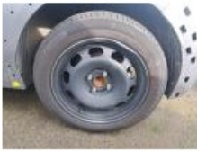
Cache bagages, Cassé, E - Remplacer