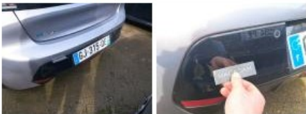
Pare-chocs AR, Griffe(s), Peindre