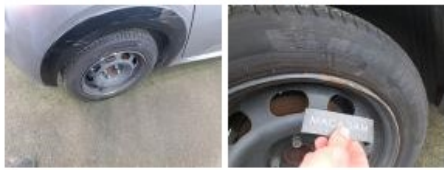
Enjoliveur de roue AVD, Manque, E - Remplacer