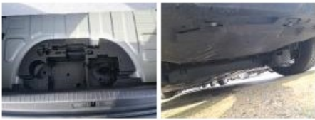
Compresseur, Manque, Réparer/rempl. (montant forfaitaire)