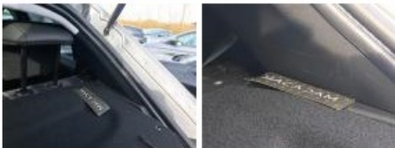
Jupe AR, Griffe(s), Peindre