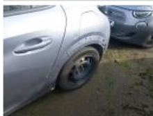
Aile ARG, Bosse(s), LI - Réparer et peindre (complet)