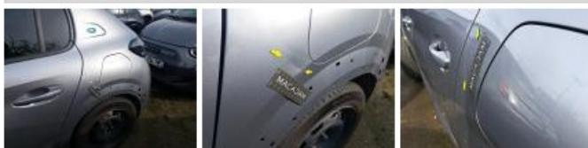
Pare-chocs AV, Griffé(s), Peindre