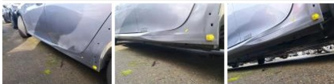
Porte ARG, Bosse(s) et griffe(s), LI - Réparer et peindre (complet)