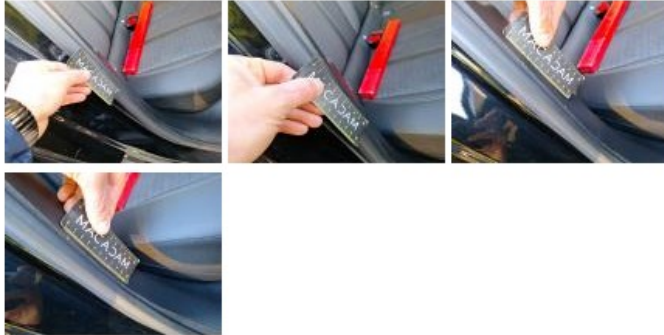
Garnit. montant Mil D, Griffe(s), Réparer/rempl. (montant forfaitaire)