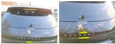
Bras d'essuie-glace AR, Incomplet, E - Remplacer