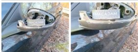
Boitier rétroviseur ext G, Manque, Le - Remplacer et peindre