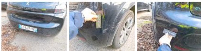
Jupe AR, Déformé / Forcé, Le - Remplacer et peindre