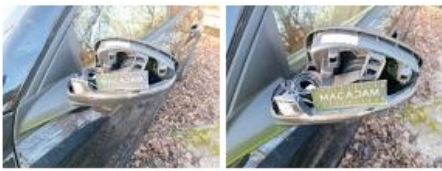
Base rétroviseur ext G, Cassé, E - Remplacer