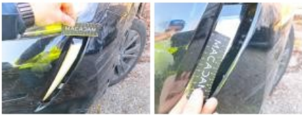
Optique AVG, Griffe(s), Acceptable