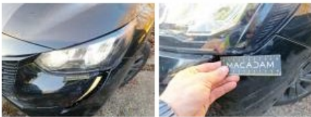
Calandre, Cassé, E - Remplacer