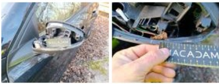
Montant de toit G, Bosse(s), LI - Réparer et peindre (complet)