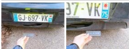
3ème feu stop, Manque, E - Remplacer