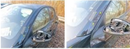
Pare-chocs AV, Déformé / Forcé, Le - Remplacer et peindre