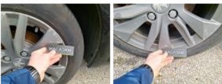
Jante alum. AVD, Griffe(s), E - Remplacer