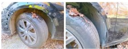
Pneu ARD, Déchirure, E - Remplacer