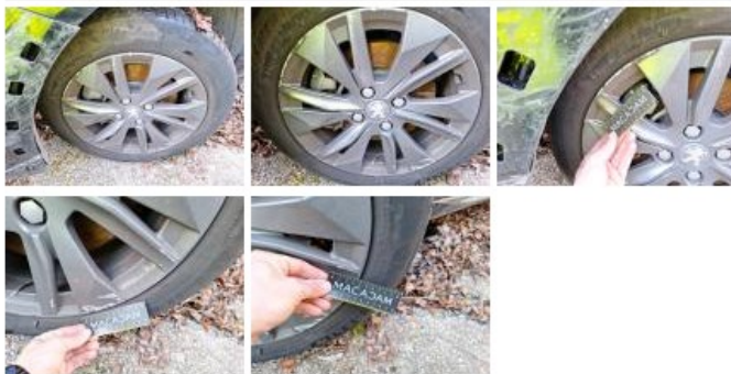
Pneu AVG, Déchirure, E - Remplacer