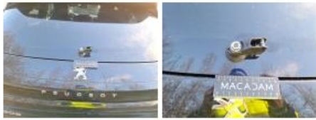
Coffre / hayon, Bosse(s), LI - Réparer et peindre (complet)