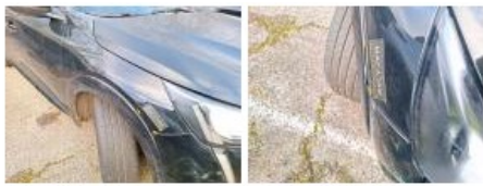
Bras d'essuie-glace AR, Cassé, E - Remplacer