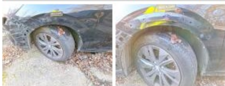
Aile AVG, Bosse(s) et griffe(s), LI - Réparer et peindre (complet)