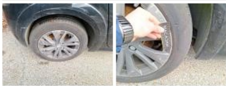
Jante alum. ARD, Griffe(s), E - Remplacer