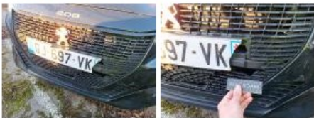
Obturateur /Cache AV, Cassé, E - Remplacer