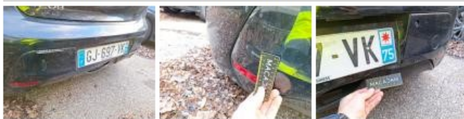
Jupe AR, Déformé / Forcé, Le - Remplacer et peindre