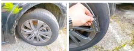
Moulure d'aile AVG, Manque, Le - Remplacer et peindre