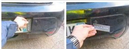
Balai d'essuie-glace AR, Manque, E - Remplacer