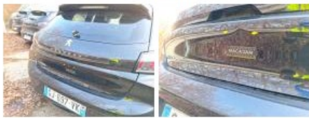
Pare-chocs AR, Griffé(s), Peindre