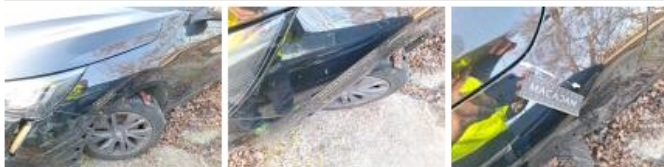
Répétiteur G, Cassé, E - Remplacer