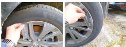
Pneu AVD, Déchirure, E - Remplacer