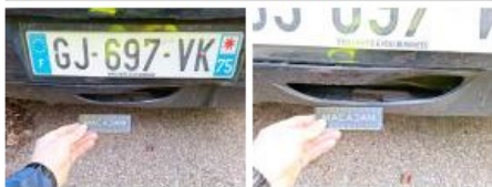
Capteur de parking AR, Dégrafé, Dépose/Répose