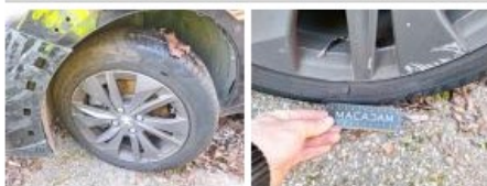
Jante alum. ARG, Griffe(s), E - Remplacer