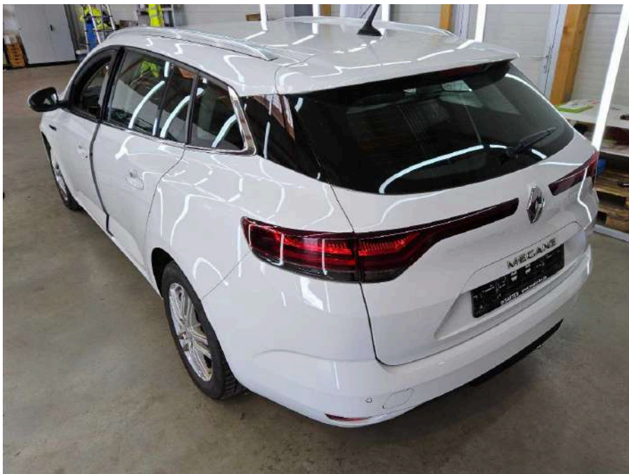
Bild 34 Fahrzeug Fahrzeug aussen Gebrauchsspuren + oberflächliche Kratzer + Steinschlag / -schläge