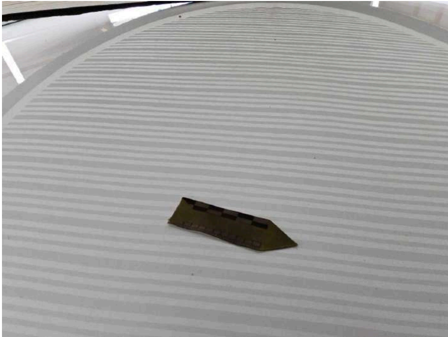
Bild 25 Dach Dachhaut Delle