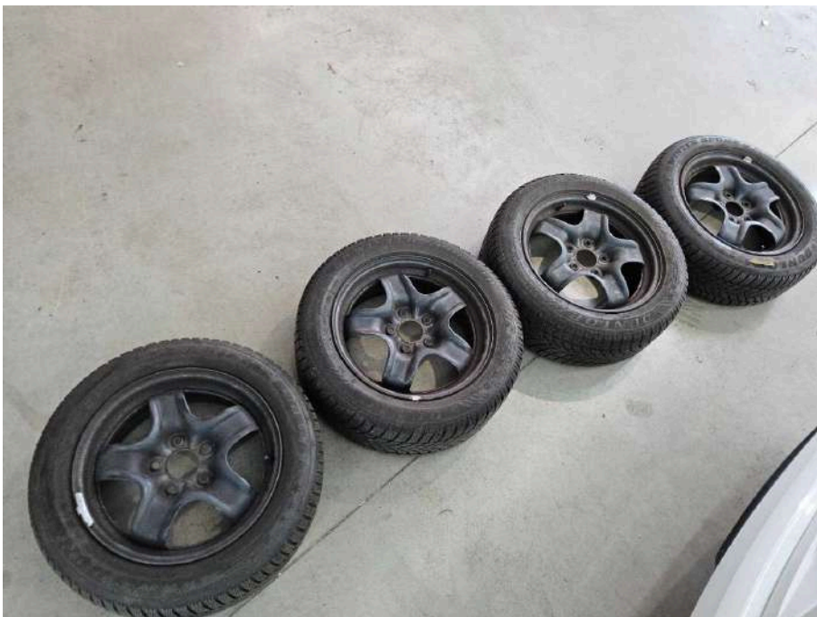
Bild 44 Fahrzeug Fahrzeug aussen Gebrauchsspuren + oberflächliche Kratzer + Steinschlag / -schläge