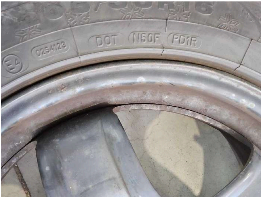
Bild 45 Fahrzeug Fahrzeug aussen Gebrauchsspuren + oberflächliche Kratzer + Steinschlag / -schläge