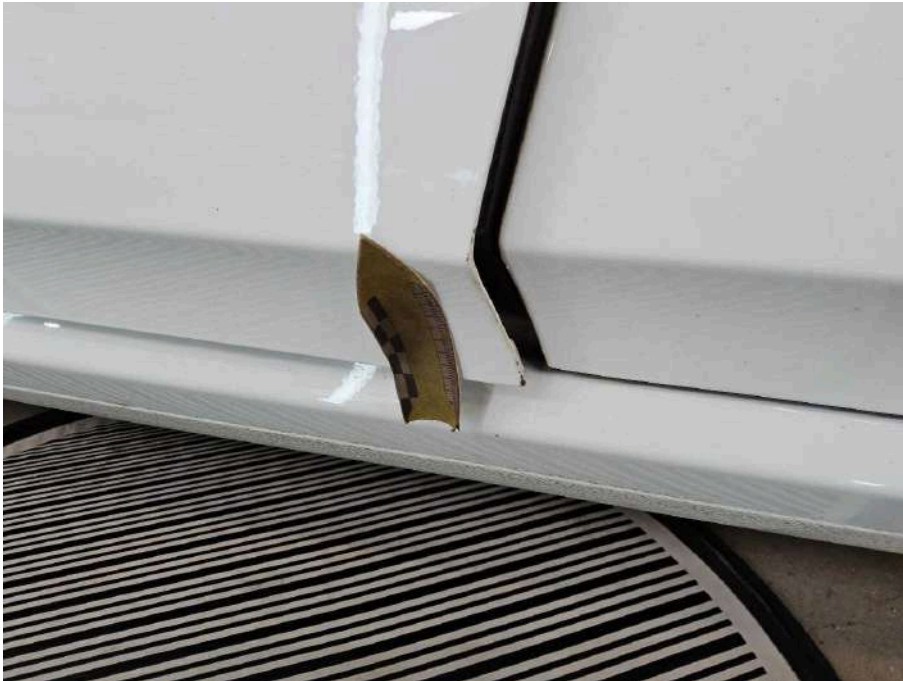
Bild 39 Fahrzeug Fahrzeug aussen Gebrauchsspuren + oberflächliche Kratzer + Steinschlag / -schläge