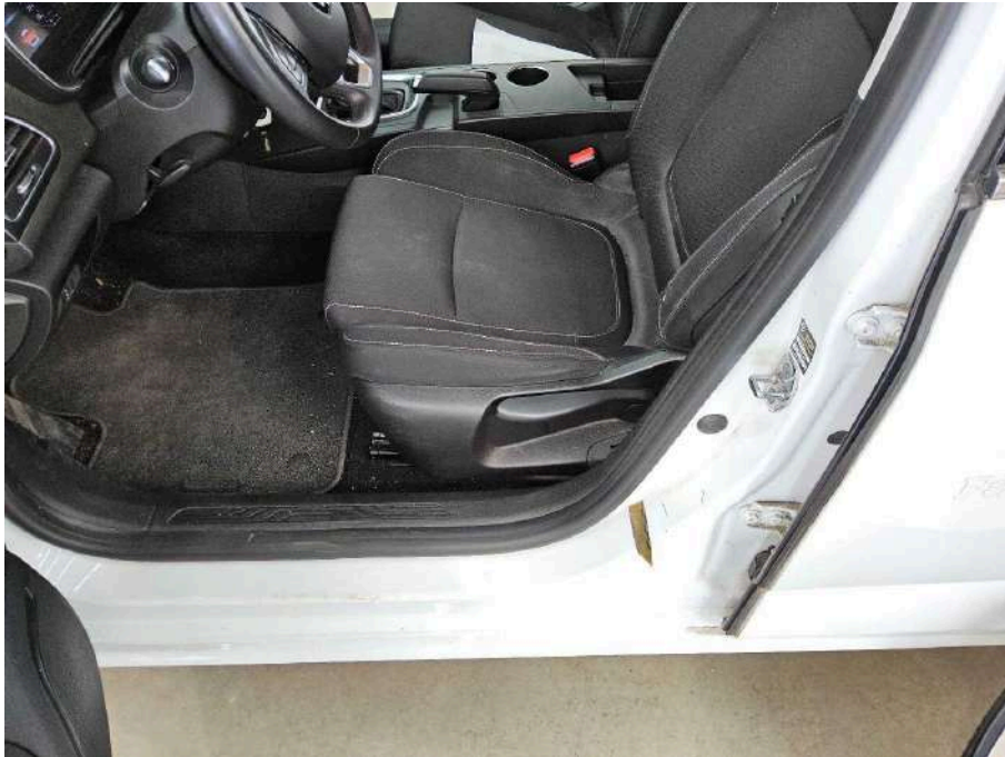
Bild 65 Innenraum Einstieg vorne links 2x Delle mit Lackbeschädigung + verkratzt