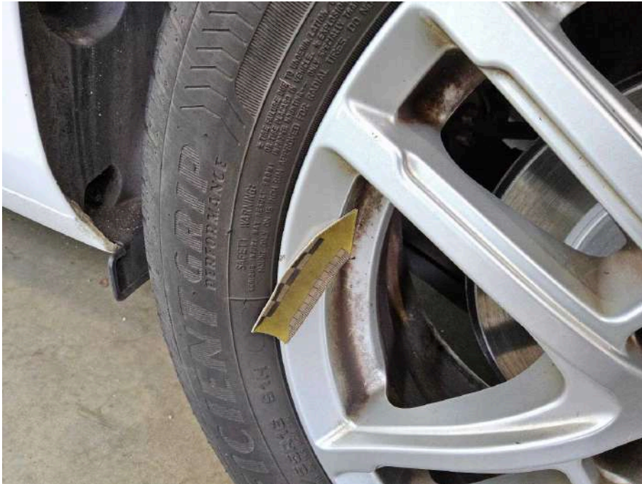
Bild 43 Fahrzeug Fahrzeug aussen Gebrauchsspuren + oberflächliche Kratzer + Steinschlag / -schläge