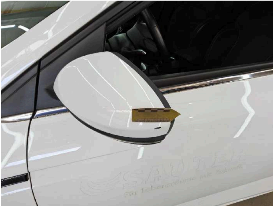
Bild 37 linke Seite Abdeckung Außenspiegel links Materialabtrag