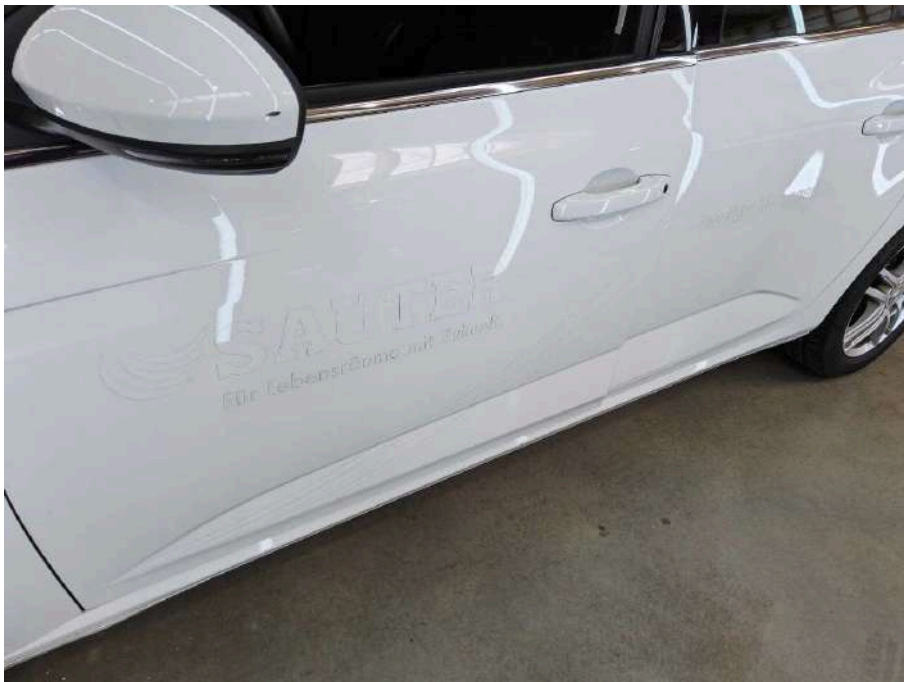
Bild 22 Fahrzeug Fahrzeug aussen Kleberückstände vorhanden