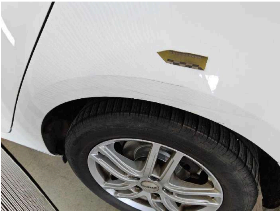
Bild 42 linke Seite Seitenteil hinten links deformiert