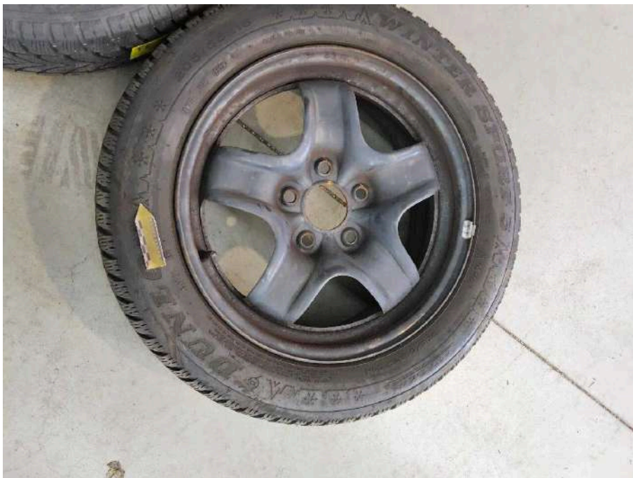
Bild 46 Fahrzeugzubehör Winterradsatz Felge deformiert