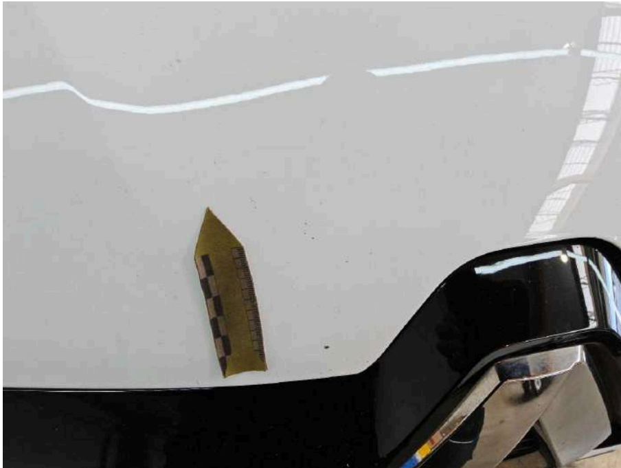
Bild 27 Fahrzeug Fahrzeug aussen Gebrauchsspuren + oberflächliche Kratzer + Steinschlag / -schläge