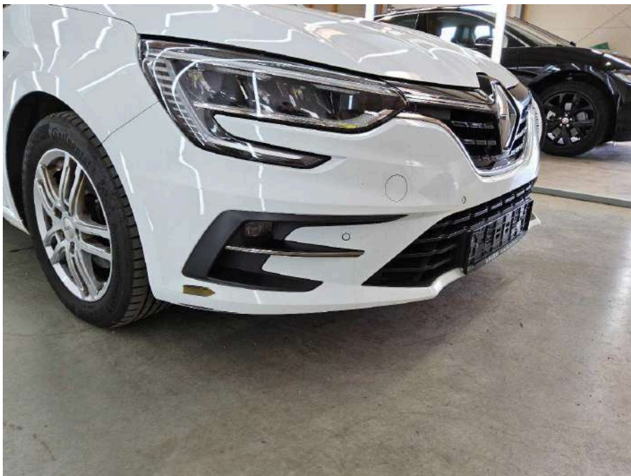
Bild 28 Fahrzeugfront Stoßfänger vorne verkratzt