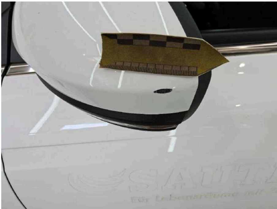
Bild 38 linke Seite Abdeckung Außenspiegel links Materialabtrag