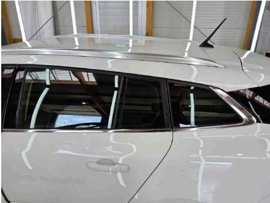
Bild 33 Fahrzeug Fahrzeug aussen Gebrauchsspuren + oberflächliche Kratzer + Steinschlag / -schläge