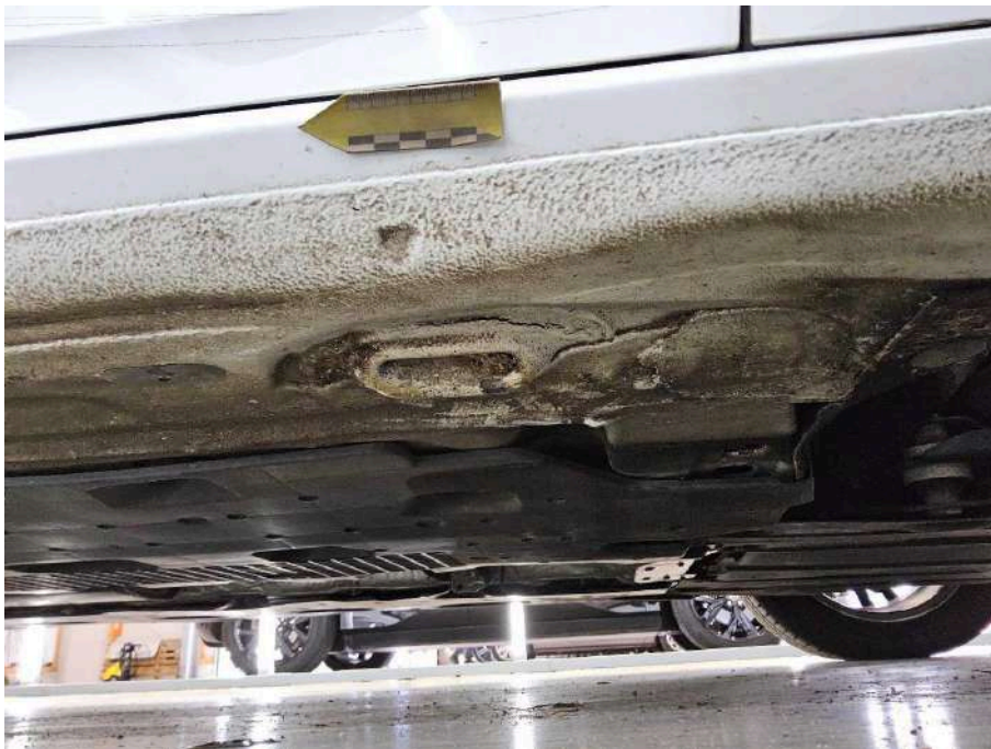
Bild 49 rechte Seite Schweller rechts deformiert