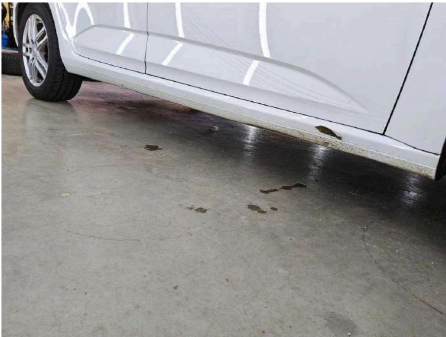
Bild 48 rechte Seite Schweller rechts deformiert