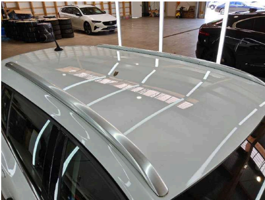
Bild 24 Dach Dachhaut Delle