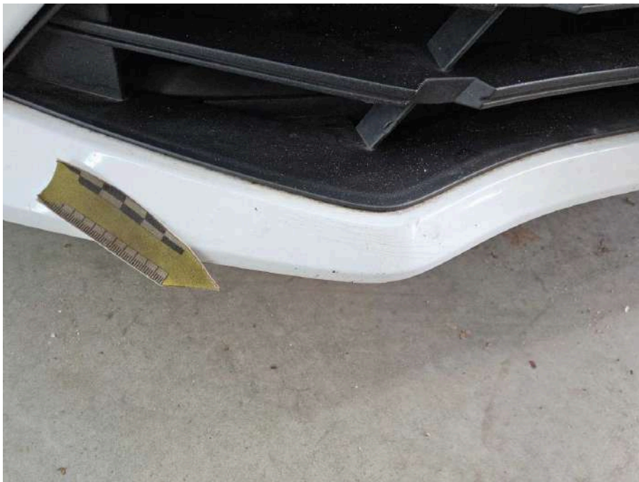
Bild 30 Fahrzeugfront Stoßfänger vorne verkratzt