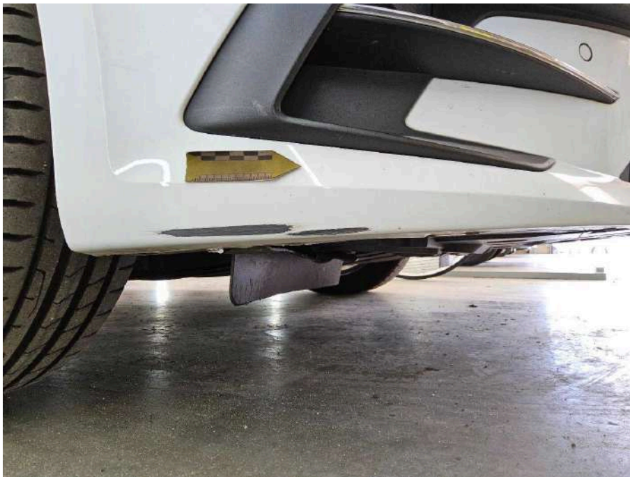
Bild 29 Fahrzeugfront Stoßfänger vorne verkratzt