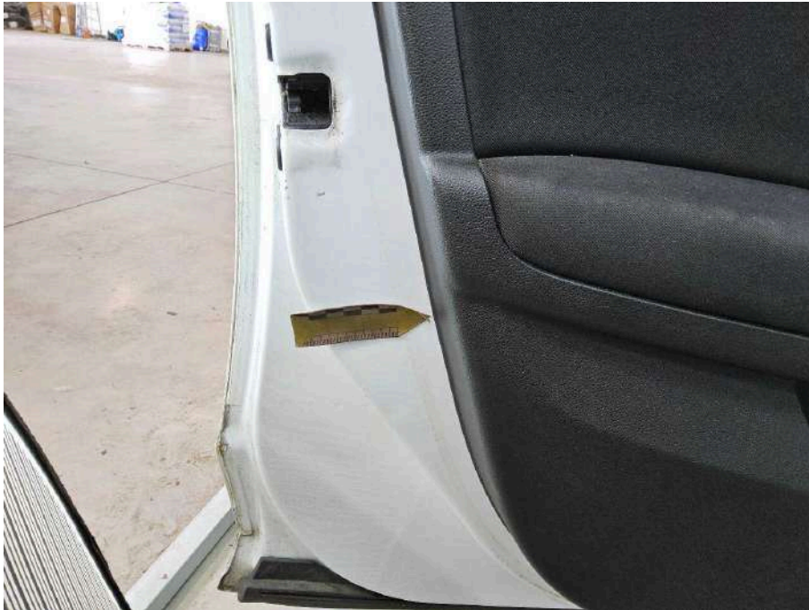
Bild 69 linke Seite Tür vorne links 2x Delle + Delle mit Lackbeschädigung