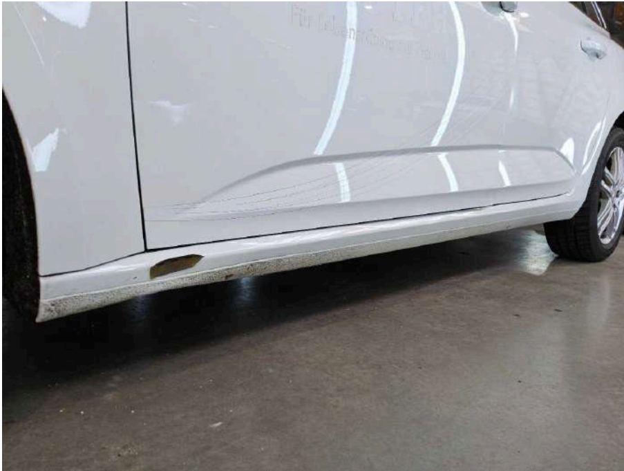
Bild 31 linke Seite Schweller links deformiert