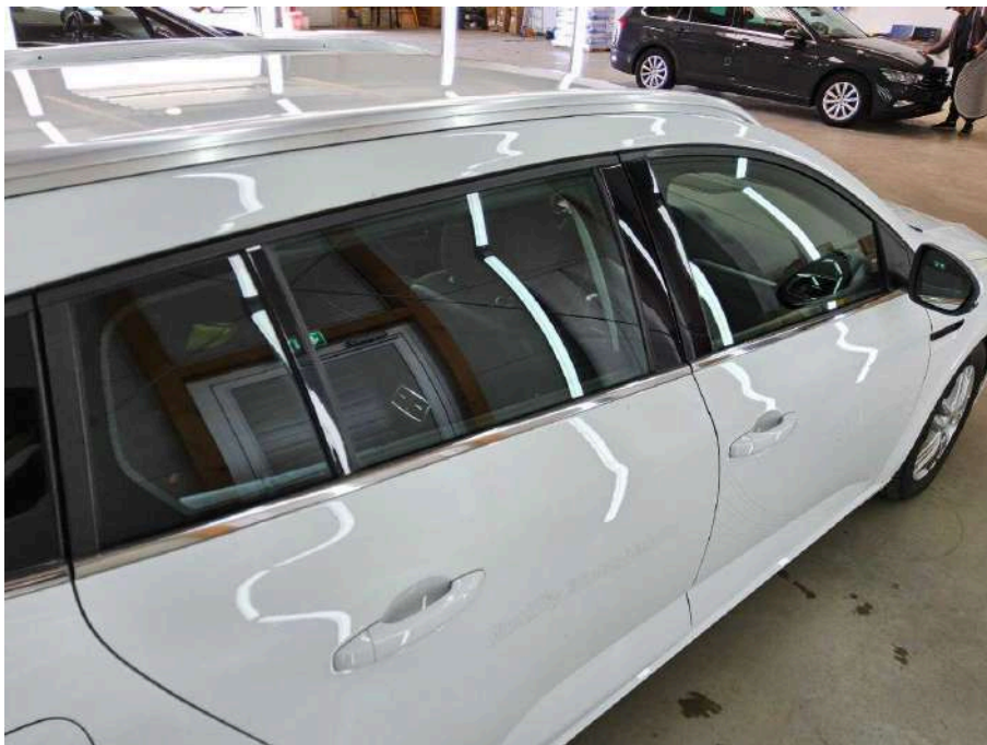
Bild 36 Fahrzeug Fahrzeug aussen Gebrauchsspuren + oberflächliche Kratzer + Steinschlag / -schläge