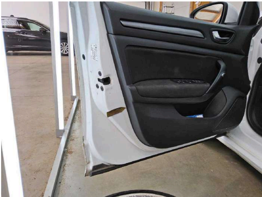
Bild 68 linke Seite Tür vorne links 2x Delle + Delle mit Lackbeschädigung