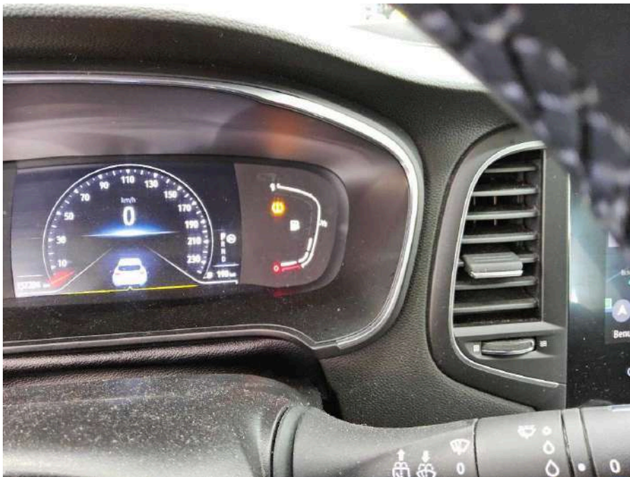
Bild 19 Systeme Reifendruckkontrollsystem aktiv / gestört