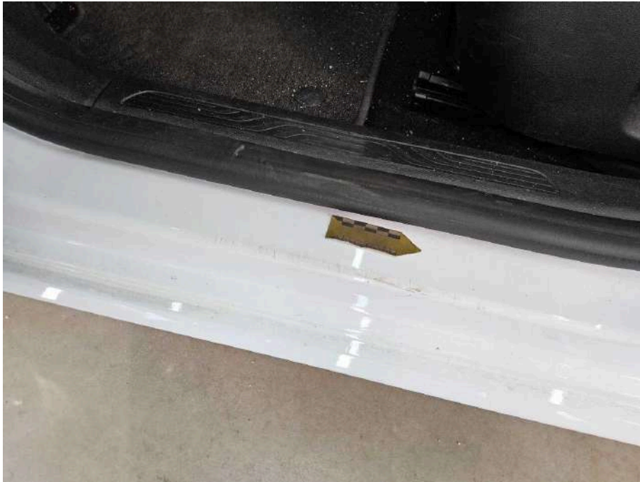
Bild 67 Innenraum Einstieg vorne links 2x Delle mit Lackbeschädigung + verkratzt