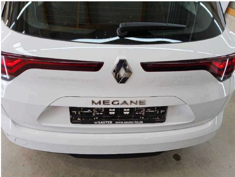
Bild 23 Fahrzeug Fahrzeug aussen Kleberückstände vorhanden