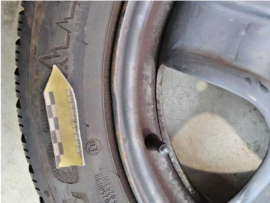
Bild 47 Fahrzeugzubehör Winterradsatz Felge deformiert