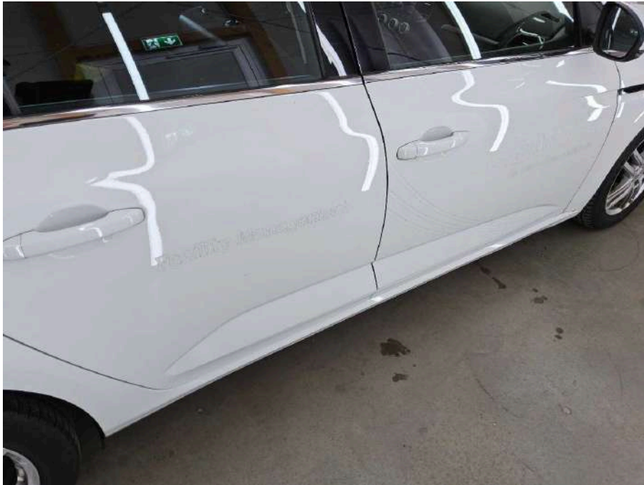
Bild 21 Fahrzeug Fahrzeug aussen Kleberückstände vorhanden