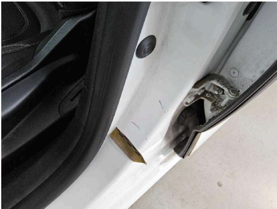
Bild 66 Innenraum Einstieg vorne links 2x Delle mit Lackbeschädigung + verkratzt