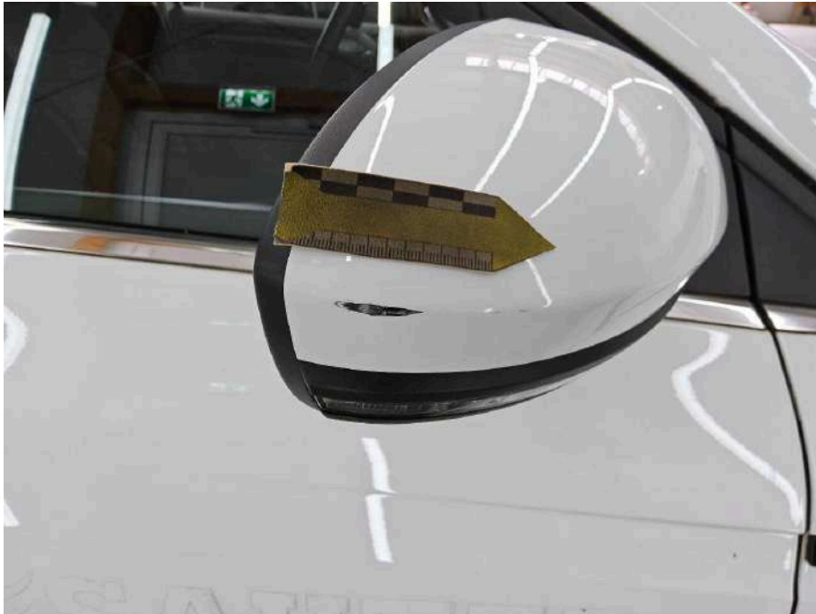
Bild 51 rechte Seite Abdeckung Außenspiegel rechts Materialabtrag