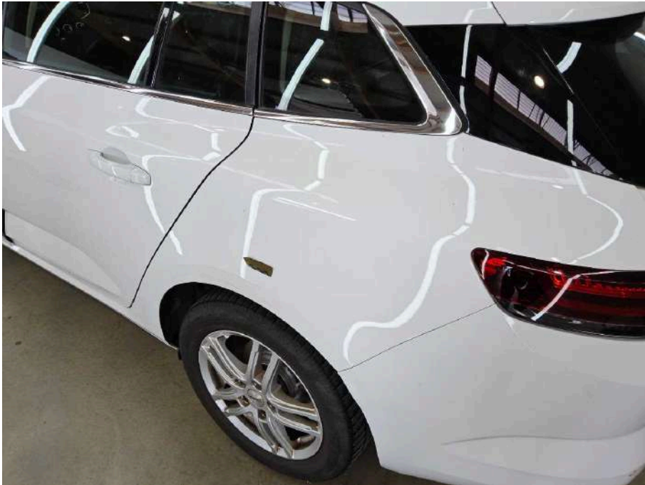
Bild 41 linke Seite Seitenteil hinten links deformiert