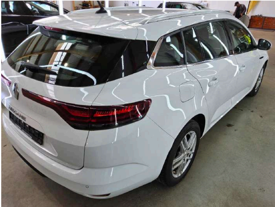
Bild 35 Fahrzeug Fahrzeug aussen Gebrauchsspuren + oberflächliche Kratzer + Steinschlag / -schläge