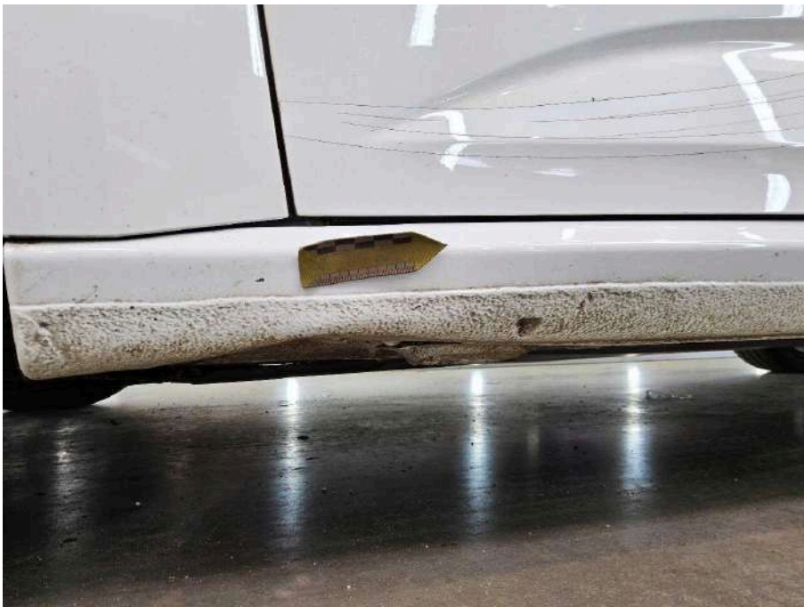
Bild 32 linke Seite Schweller links deformiert