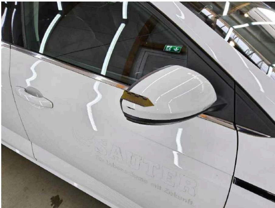
Bild 50 rechte Seite Abdeckung Außenspiegel rechts Materialabtrag