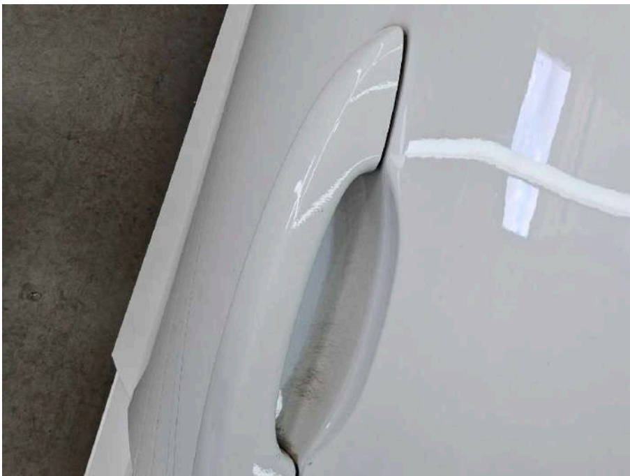
Bild 40 Fahrzeug Fahrzeug aussen Gebrauchsspuren + oberflächliche Kratzer + Steinschlag / -schläge