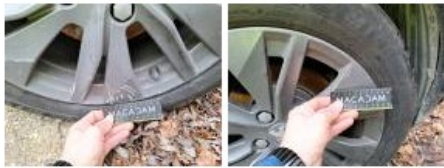
Pneu ARG, Déchirure, E - Remplacer