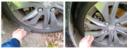
Pneu AVG, Déchirure, E - Remplacer