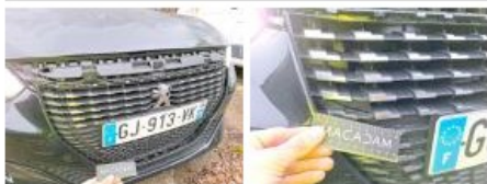
Pare-chocs AV, Cassé, LI - Réparer et peindre (complet)