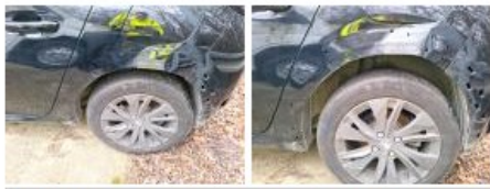
Aile ARG, Bosse(s), LI - Réparer et peindre (complet)