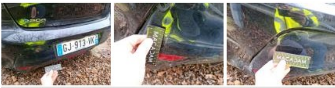
Capteur de parking AR, Manque, E - Remplacer