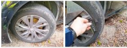
Jante alum. ARG, Griffe(s), E - Remplacer