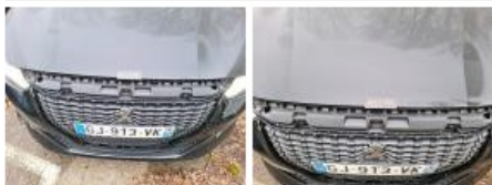
Monogramme marque AV, Manque, E - Remplacer