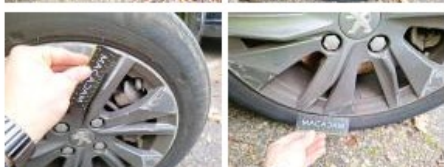
Pneu AVD, Déchirure, E - Remplacer