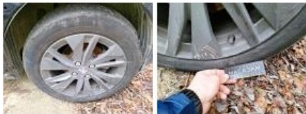
Enjoliveur de roue ARD, Manque, E - Remplacer