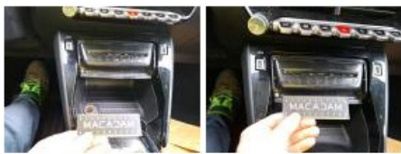
Ciel de toit, Griffe(s), E - Remplacer