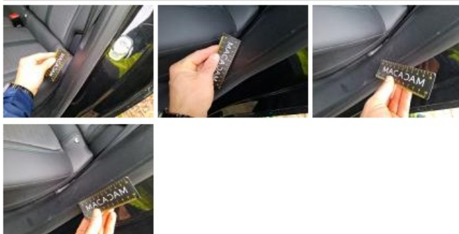
Garniture porte ARG, Griffe(s), Réparer/rempl. (montant forfaitaire)