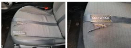
Voyant défaut, Allumé, Contrôler