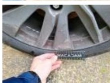
Jante alum. AVD, Griffe(s), E - Remplacer