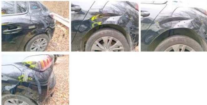
Porte AVG, Bosse(s), LI - Réparer et peindre (complet)