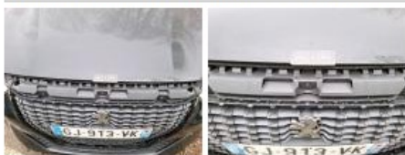
Calandre, Cassé, E - Remplacer