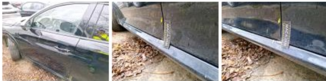
Moulure d'aile AVG, Griffes(s), Peindre