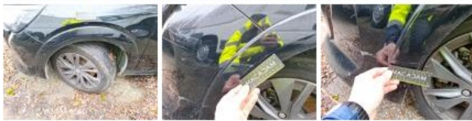
Calandre, Manque, E - Remplacer