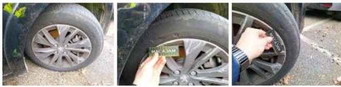
Moulure d'aile ARG, Manque, E - Remplacer