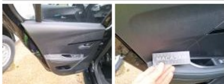
Revêtement assise siège AVG, Déchirure, E - Remplacer