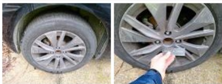
Jante alum. ARD, Griffe(s), E - Remplacer